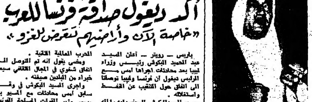
أكد ديغول صدقة فرنسا للعرب خاصة لان وارضيتهم تتعرض للغزو

وقال السيد الكوشي ورئيس وزراء ليبيا بعد محادثات اجراها امس مع الرئيس ديغول ان فرنسا وليبيا توسعا الى اتفاق حول التقيب عن النفط واستغلاله . وصرح السيد الكوشي للمصنعي دوله عن اتصالاته مع الحكومة الفرنسية اثناء زيارته بقوله انه توصلنا الى اتفاقات ولسلك يقول انه وصلنا الى اتفاق على اسس اقترح اياه للتقيب عن النفط واستغلاله ونحن نتوقع تمولنا اسبقاً في المستقبل في اشارة صناعة بترولية . وقال السيد الكوشي في ختام زيارته التي استغرقت ثلاثة ايام وكثفت اول زيارة يقوم بها رئيس حكومة ليبيا لفرنسا انه نقل رسالة شجوية من الملك ادريس الى الرئيس ديغول . وقال ان الهدف من هذه الرسالة هو تعزيز الروابط بين ليبيا وارساد اسس التعاون بين حكومتنا . واضاف يقول انه دعا الرئيس ديغول الى زيارة ليبيا وليبيا للحرك حيث قال جرد من البلدين كعلاء في